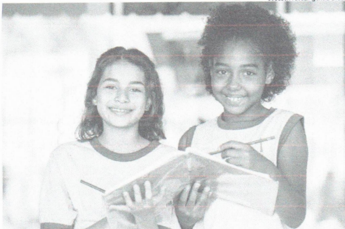
Apenas as matrículas criadas ou convertidas em tempo integral a partir de 1º de janeiro de 2023 poderão ser contadas para fins de participação no programa

O investimento total ao longo do programa será de R$ 4 bilhões e vai permitir que estados, municípios e o Distrito Federal possam expandir a oferta de jornada em tempo integral em suas redes. A meta é alcançar, até