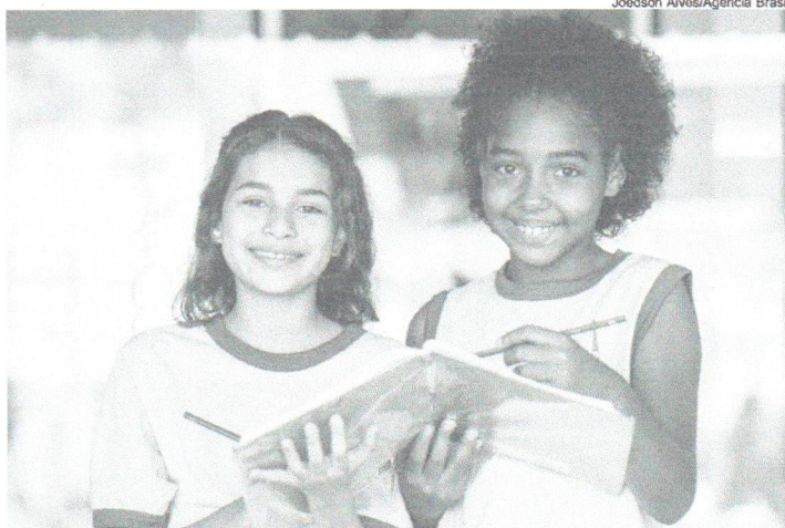
Apenas as matrículas criadas ou convertidas em tempo integral a partir de 1º de janeiro de 2023 poderão ser contadas para fins de participação no programa

O investimento total ao longo do programa será de R$ 4 bilhões e vai permitir que estados, municípios e o Distrito Federal possam expandir a oferta de jornada em tempo integral em suas redes. A meta é alcançar, até