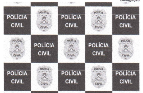
Operação teve como objetivo dar cumprimento a mandados de busca na cidade de Paraíso

No decorrer dos trabalhos investigativos, foi apurado que os indivíduos se utilizavam de métodos de dissuasão para convencer vítimas a encaminharem os "nudes", envolvendo até promessas em dinheiro que não eram cumpridas. Em outros casos, era realizada invasão do aparelho celular da vítima para obter as fotos.