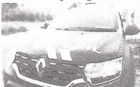
Caso foi investigado pela 30ª Delegacia da Polícia Civil de Araguaínas

A Polícia Civil do Tocantins (PC-TO), por meio da 10ª Delegacia de Araguaínas, no Extremo Norte do Estado, concluiu nesta quinta-feira, 16, uma investigação iniciada com o objetivo de apurar um crime de estelionato praticado em face de um morador de Araguaínas, mas que no curso da marcha investigativa terminou por descobrir a existência de uma organização criminosa que, de dentro do maior presídio de Cuiabá (MT), tem feito vítimas em vários Estados. São no mês de dezembro de 2022, a organização obteve mais de R$ 300 mil com a prática de golpes.