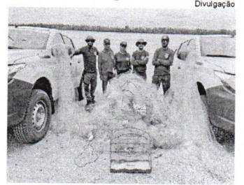
Pescado apreendido foi doado a Instituição que atende pessoas carentes

A iniciativa oferece a professoras de língua inglesa da educação básica, em exercício na rede pública de ensino brasileira, a oportunidade de um curso intensivo em universidades nos Estados Unidos, com atividades acadêmicas e cul-