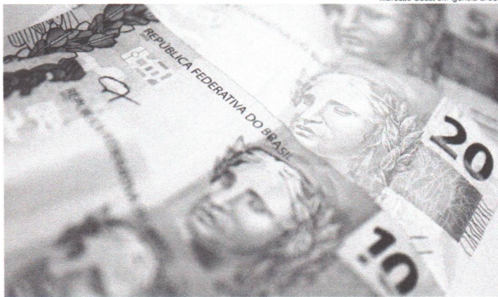
Montantes de até R$ 10 concentram 69,7% do total

Nas faixas mais altas, houve 36 mil liberações de valores entre R$ 10.000,01 e R$ 100 mil (apenas 0,11% dos casos). Apenas 1.318 transferências resultaram em liberação de valores acima de R$