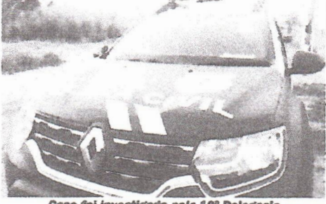
Caso foi investigado pela 10ª Delegacia de Polícia Civil de Araguaatins

A Polícia Civil do Tocantins (PC-TO), por meio da 10ª Delegacia de Araguaatins, no Extremo Norte do Estado, concluiu nesta quinta-feira, 16, uma investigação iniciada com o objetivo de apurar um crime de estelionato praticado em face de um morador de Araguaatins, mas que no curso da marcha investigativa terminou por descobrir a existência de uma organização criminosa que, de dentro do maior presídio de Cuiabá (MT), tem feito vítimas em vários Estados. Só no mês de dezembro de 2022, a organização obteve mais de R$ 300 mil com a prática de golpes.