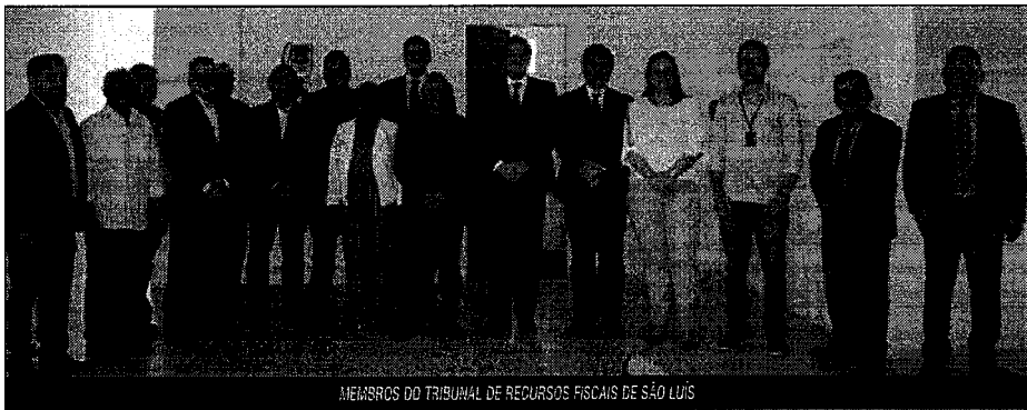
MEMBROS DO TRIBUNAL DE RECURSOS FISCAIS DE SÃO LUÍS

Nesta segunda-feira (20), foi implantado, na Secretaria Municipal da Fazenda (Semfaz), o Tribunal Administrativo de Recursos Fiscais do Município de São Luís (CCM). O Tribunal é um órgão administrativo colegiado, com autonomia decisória, vinculado à Prefeitura de São Luís por meio da Semfaz, que vai propiciar maior celeridade nos julgamentos dos processos administrativos resultantes de infração à legislação tributária e fiscal, assim como, unificar a Primeira e Segunda Instâncias de Julgamento.